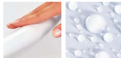
Perleffekt auf der CLEAN-Oberfläche